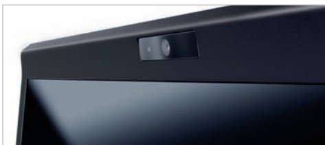
Webcam intégrée : n'est pas disponible sur le Satellite Pro A200-1AQ