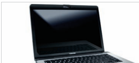
Ecran large 15,4" Toshiba TruBrite® : des images plus précises et une productivité accrue