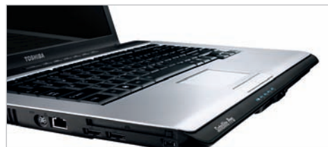
Style mobile : définissez la tendance avec cet ordinateur portable au design unique.